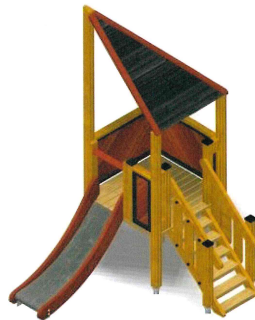
SCIVOLO + TORRE