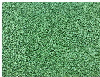
PAVIMENTAZIONE ANTICADUTA RUB TAN